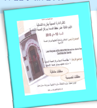
Bizerte Nord le 15 Mai 2010