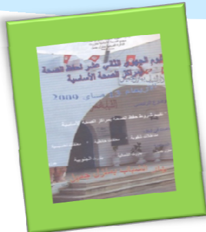
Utique le 13 Mai 2010