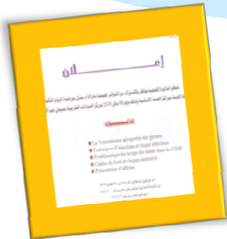
Mateur le 8 Mai 2010

XIII èmes Journées Régionales d'hygiène des CSB de Bizerte Les 08, 13, 15 et 22 Mai 2009