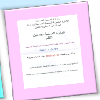
Joumine le 22 Mai 2010

XX ème Congrès National de la Société Française d'Hygiène Hospitalière – Bordeaux – France Les 5 et 6 Juin 2010